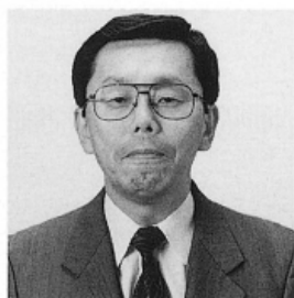
全国印刷緑友会 第19代会長