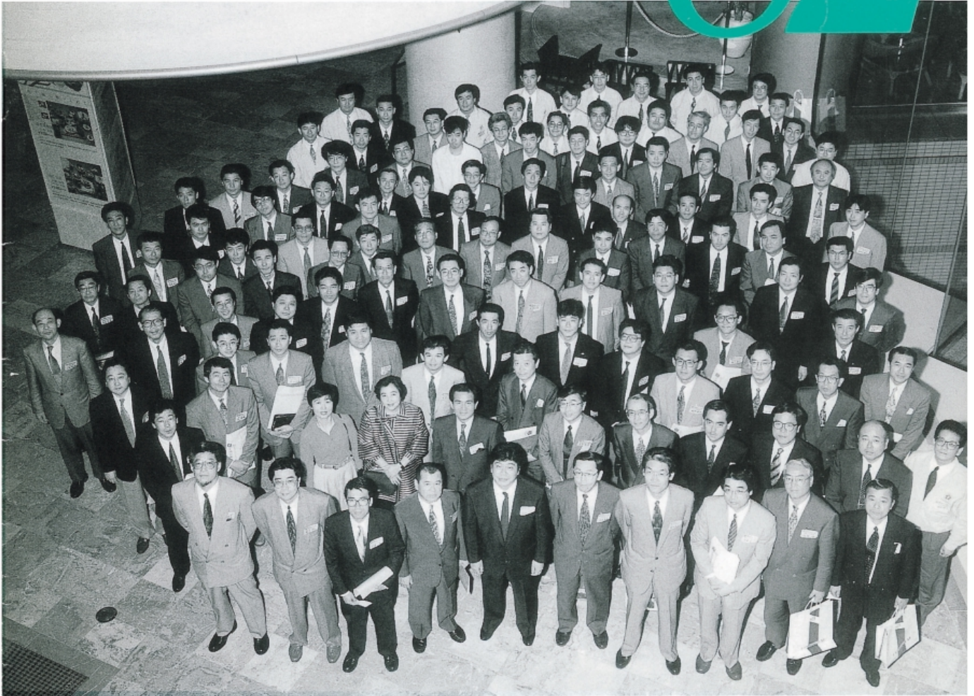
第36回 全国印刷緑友会 大分総会