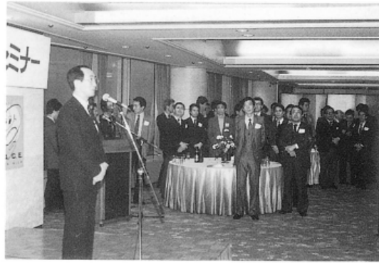
あーあー・ノドが乾いた早く乾杯を!!