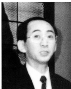
全国印刷緑友会会長