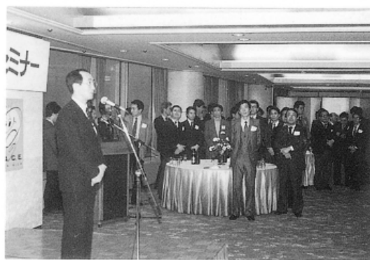
あーあー・ノドが乾いた早く乾杯を!!