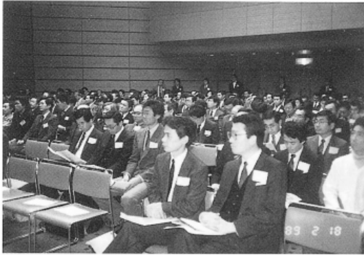
熱心に講義を受ける緑友の仲間