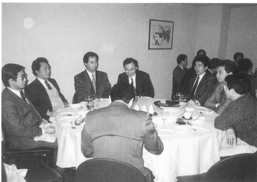
2月2日赤坂プリンスホテルに於て、在京8グループの代表者が集まり次期セミナーの確認、各グループの近況報告が行なわれた。21名参加