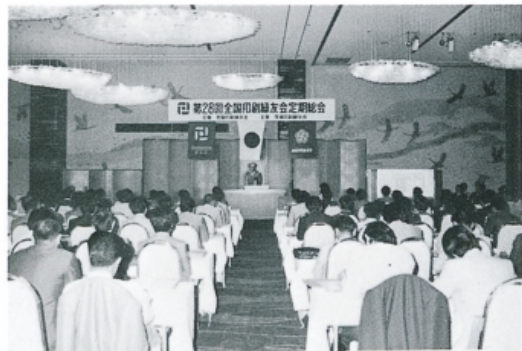
総 会 場