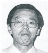
前出猛男君 金沢青年印刷人クラブ