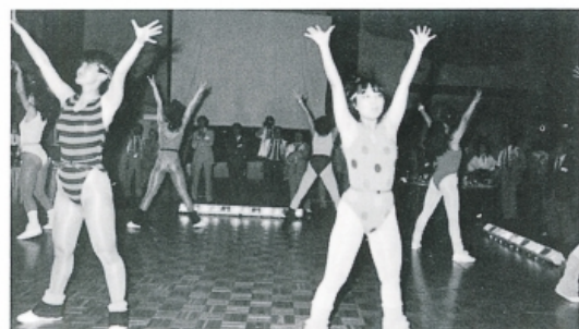
茨城緑友パピリオンのピチピチギャルロボット?